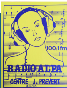
1 er logo de Radio Alpa (1982 > 1989)

UNE HISTOIRE DE LA RADIO DES DÉBUTS DE LA TSF À LA WEB RADIO